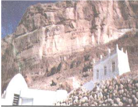
مُصلى الشيخ أبي بكر بن سالم