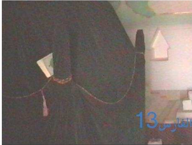
ضريح العطاس المقدس بالمشهد

من التقديس المحرم للأضرحة أن تكسى بالأكسية كما تكسى الكعبة المشرفة . وفي بعض بلاد المسلمين تكسى كساءً أسوداً تشبهاً بكساء الكعبة الأسود ومنها قبة المشهد في حضرموت، وفي بعض مناطق حضرموت الأخرى تكسى كساءً أخضرًا تسمى ( التليسة ) ويصبح يوم التليسة يوم احتفال كبير للقبوريين عند هذا الضريح وتتسابق الأيدي للتبرك بهذا الكساء .