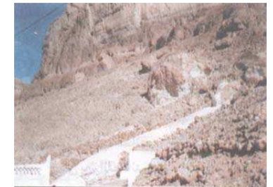
امتداد القبر في الجبل ( ولقد كان الذين دفنوه حمقى حيث تكسوه فجعلوا رأسه إلى أسفل ورجليه إلى أعلى )