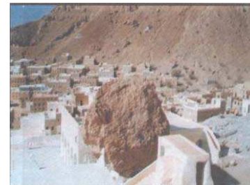
صخرة الناقة التي يزعمون أنها ناقة هود المتحجرة