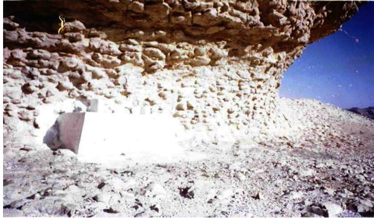
ضريح الصحابي عباد بن بشر المكتشف باللسك

فأجاب رب العالمين دعاءه وأحاطه بثلاثة جدران حتى اغتدت أرجاؤه بدعائه في عزة وحماية وصيان ولقد غدا عند الوفاة مصرحاً باللعن يصرخ فيهما بأذان وعن الأئمة جعلوا القبور مساجداً وهم اليهود وعابدوا الصليان والله لولا ذلك أبرز قبره لكنهم حجبوه بالحيطان