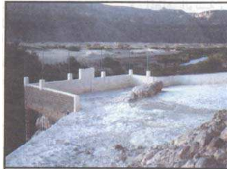
حصاة عمر الحضار