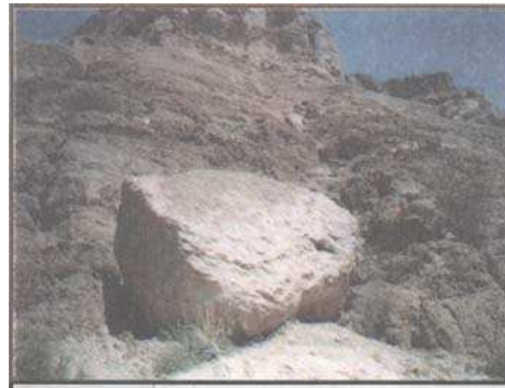
المحفظة أي « المرجم » وترى عليها ويجوارها أكوام الحجارة التي رجمت بها