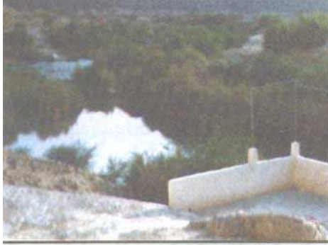
النهر المقدس . الذي من أنهار الجنة في زعمهم